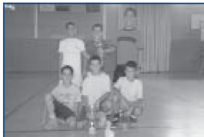
Bàsquet 3x3 1r i 2n Categoria Aleví