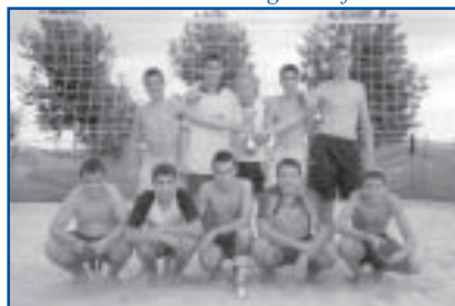
Volei 4x4 1r i 2n Categoria Cadet