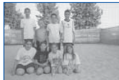
Volei 4x4 3r i 4n Categoria Aleví