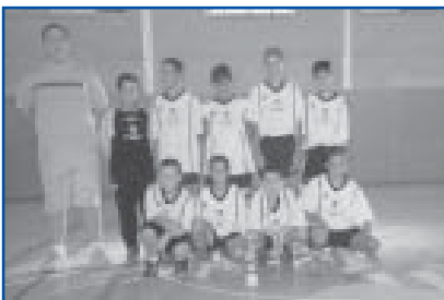
Futbol Sala, cat. Infantil. Sots-campió