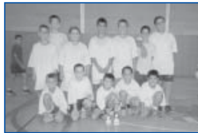
Futbol Sala, cat. Benjamí. Campió