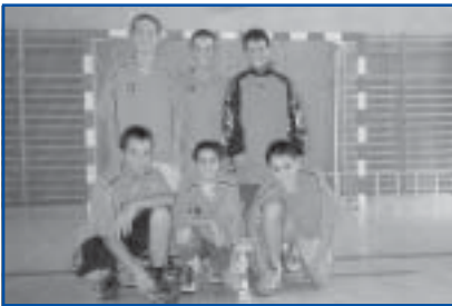
Futbol Sala, cat. aleví. Campió