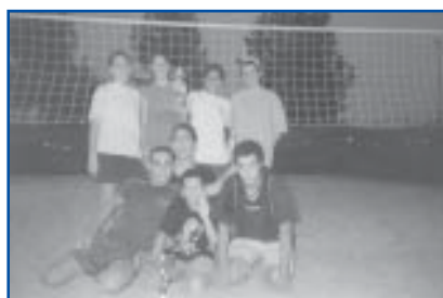
Volei 4x4 1r i 2n Categoria Infantil