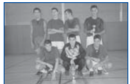
Futbol Sala, cat. Cadet. Sots-campió