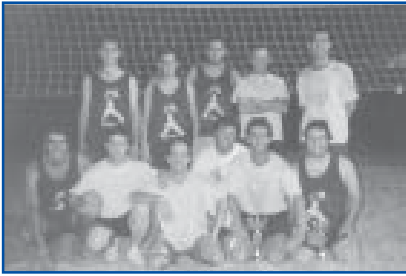
Volei 4x4 Sènior masc. Campió i subcampió