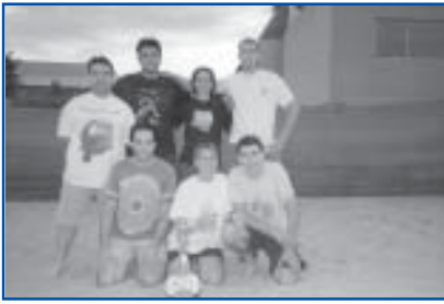
Volei 4x4. Sènior mixte. 2n clas.