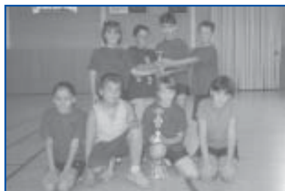
Bàsquet 3x3 3r i 4t Categoria Benjamí

I fins l'any que ve anem ara a fer un exercici de nostàlgia i repassem els veritables protagonistes del torneig, els seus participants, això sí, esperant amb el doble de ganes, la propera celebració annual.