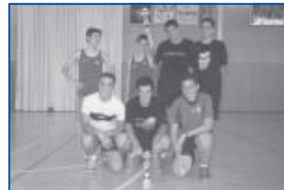
Bàsquet 3x3 1r i 2n Categoria Infantil