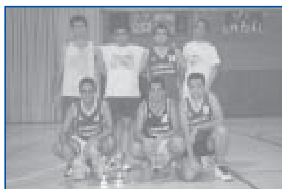
Bàsquet 3x3 1r i 2n Categoria Sènior Masculí