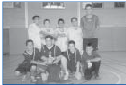
Futbol Sala, cat. aleví. Sots-campió