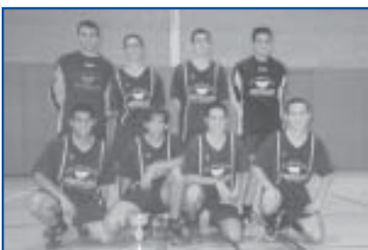
Futbol Sala, cat. Juvenil. Campió.