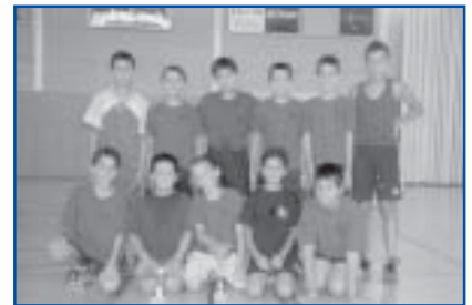
Futbol Sala, cat. Benjamí. Sots-campió