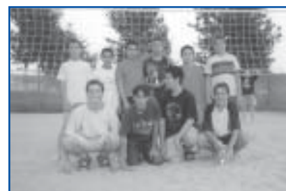
Volei 4x4 3r i 4t Categoria Infantil