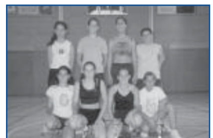
Futbol Sala Femeni. Campió i sots-campió