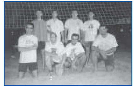
Volei 4x4 Sènior masc. 3r i 4t clas.