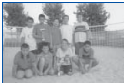
Volei 4x4 1r i 2n Categoria Aleví