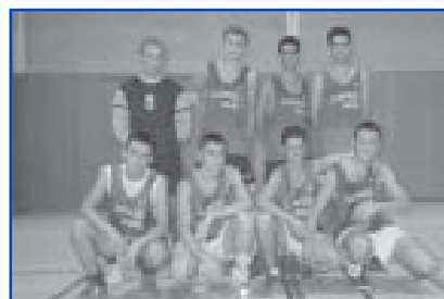
Futbol Sala, cat. Juvenil. Sots-campió