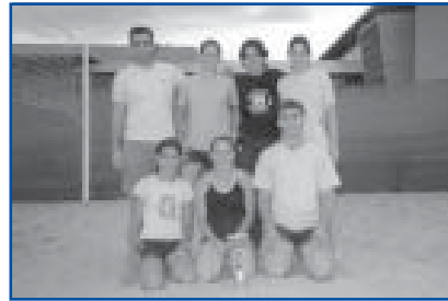
Volei 4x4. Sènior mixte. Campió