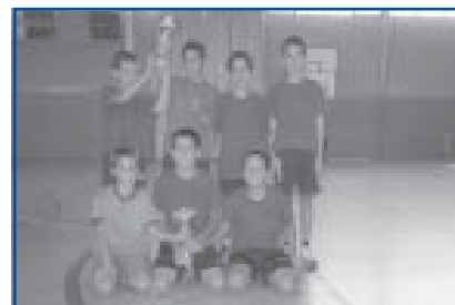
Bàsquet 3x3 1r i 2n Categoria Benjamí