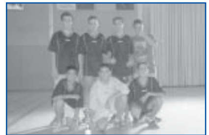
Futbol Sala, cat. Infantil. Campió.