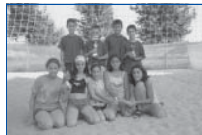
Volei 4x4 1r i 2n Categoria Benjamí